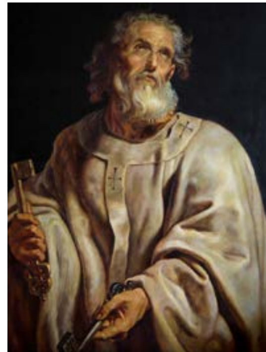
Sv. Petr - Peter Paul Rubens

Tak můžeme i my s Petrovým nástupcem, papežem Františkem, vkročit skrze Svaté brány do jubilejního roku 2025. Ať již na dálku či osobně u příležitosti národní pouti do Říma, pojdme se stát poutníky víry a posilovat jednotu církve, kterou Ježíš na Petrovi postavil.